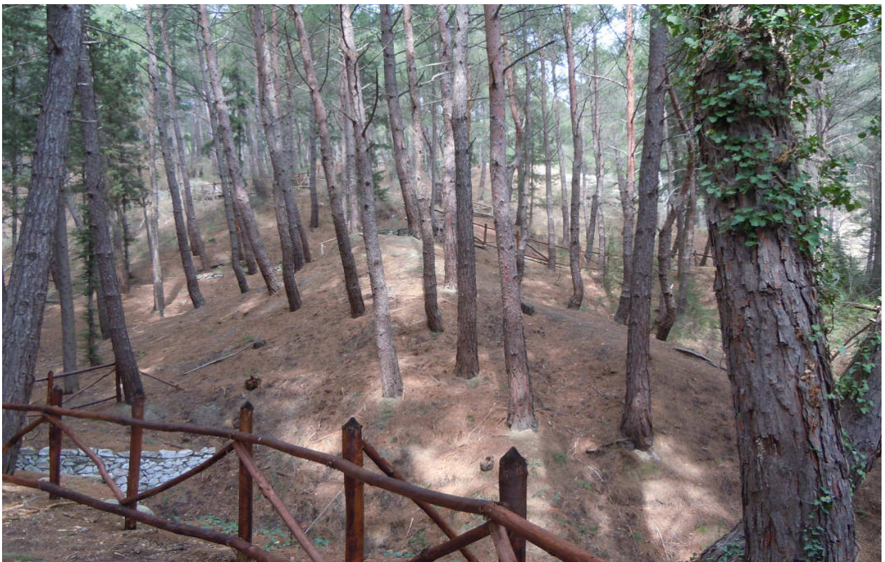
(Φωτ. 1) Άποψη του χώρου δασικής αναψυχής ΠΑΙΔΙΚΟ ΑΛΣΟΣ» Ξάνθης

Ο οργανωμένος χώρος δασικής υπαίθριας αναψυχής «ΠΑΙΔΙΚΟ ΑΛΣΟΣ» Ξάνθης, εμβαδού περίπου ογδόντα (80) στρεμμάτων, είναι δημόσια δασική έκταση και ανήκει στο Ελληνικό Δημόσιο. Αποτελεί τμήμα του περιαστικού δάσους Ταξιάρχων Ξάνθης και διαχειρίζεται από το Δασαρχείο Ξάνθης.