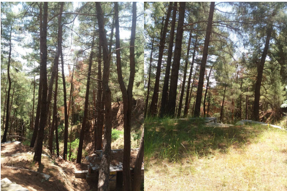
(Φωτ. 3) Ξερά ιστάμενα δένδρα