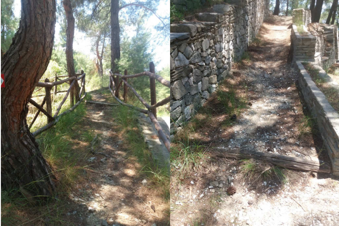
(Φωτ. 2) Υφιστάμενη κατάσταση υπάρχουσών σκαλοπατιών

τμήμα της υπάρχουσας περιφραξης. Παρόλα αυτά όμως εξακολουθούν να υπάρχουν ξύλινες κατασκευές που είναι κατεστραμμένες και χρήζουν ανακατασκευής. Επίσης σε διάφορα σημεία του χώρου υπάρχουν ξερά ιστάμενα δέντρα τα οποία εγκυμονούν κινδύνους για τον επισκέπτη. Αποτέλεσμα των προαναφερομένων είναι ο υπάρχων χώρος να μην εκπληρώνει τον σκοπό για τον οποίο δημιουργήθηκε.